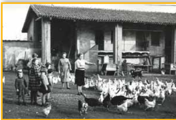
L'aia della Cascina Foissata negli anni '50 del '900, con le galline ed i tacchini