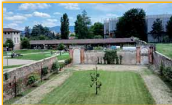
Il giardino della villa padronale, oggi.

"un corpo di cassina ... con fabbriche civili e rustiche, Cappella, mobili, effetti, compreso pure il beneficio delle ore 43 d'acqua che gode settimanalmente per l'irrigamento de prati."