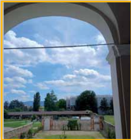
Veduta sul giardino recintato della villa padronale da una delle 12 arcate.

Arriviamo quindi al 1791, anno in cui Amedeo Grossi descrive così la proprietà: