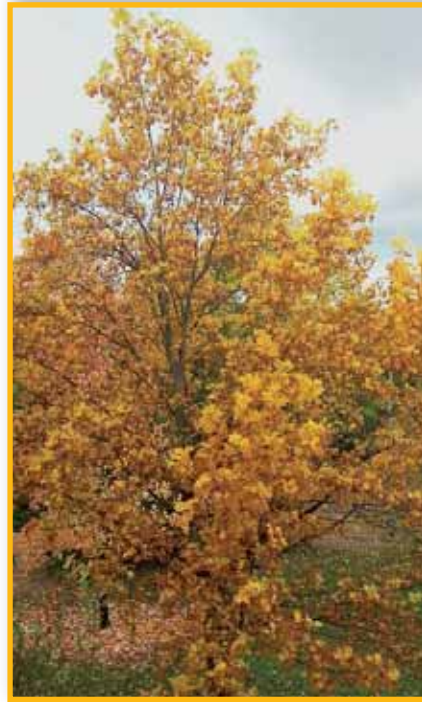
Faggio in autunno