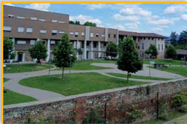
Le nuove case sorte sull'area della Cascina Fossata, in parte destinate a Social Housing .