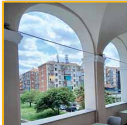
Veduta dal primo piano della villa padronale, con sullo sfondo i palazzi di Borgo Vittoria.

Nel 1820 la proprietà del complesso passerà al Re Carlo Felice e, nel 1840. a sua moglie, la Regina Maria Cristina .